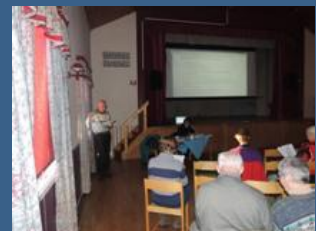
Byalaget höll årsstämma den 3 mars 2013

"I natt smidde jag tusen planer. I morse gjorde jag precis som vanligt." / /Konfucius